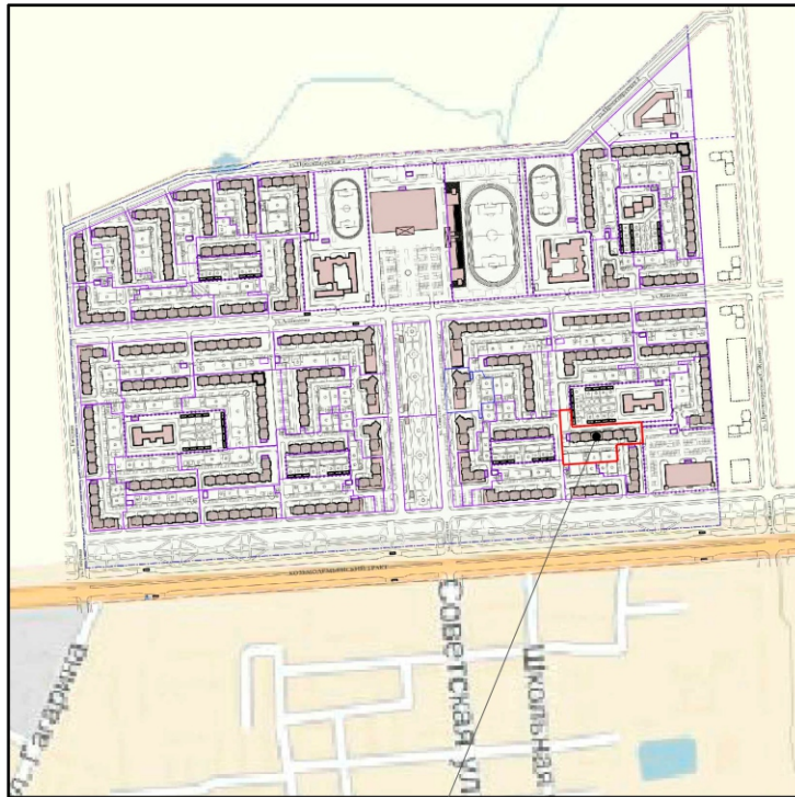
Проектируемый жилой дом поз.27